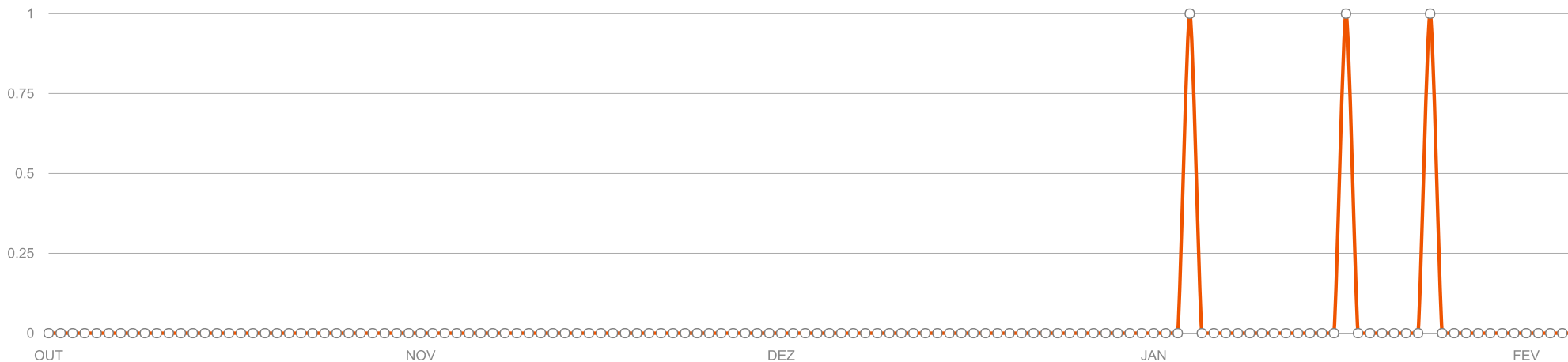
Protocolos por Dia