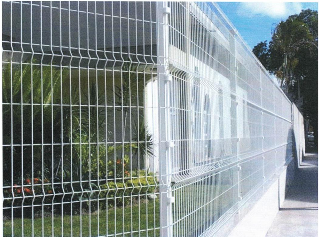
Imagem 01: modelo do Gradil.

A seguir a Figura mostra um modelo similar do gradil a ser executado.