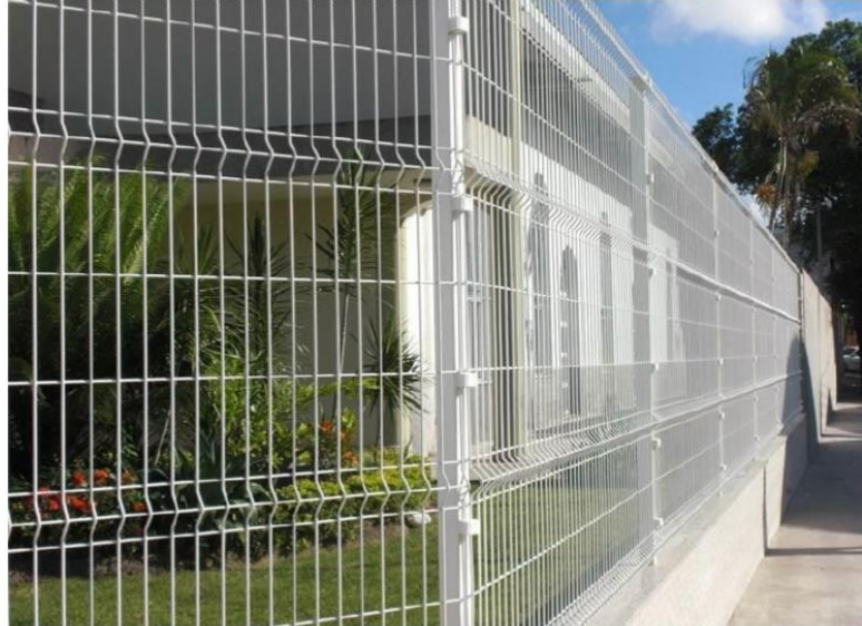
Imagem 01: modelo do Gradil.

Av. Santa Rita, 150 – Centro - Perdigoão / MG - CNPJ – 18.301.051/0001-19 Fax: (37) 3287-1030 E - mail: prefeituradeperdigaogabinete@gmail.com